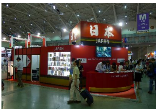
私が行った二日目。閑散としていた。 過去の盛況時の面影は感じられない。