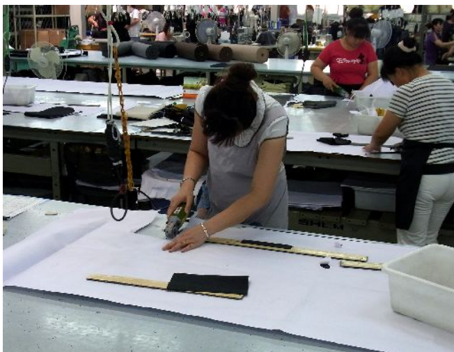
生地の上に型紙をのせて裁断

もちろんそうです。販売は北京市内の2店舗のみです。広告も日本人向けフリーペーパー以外は出していません。マス媒体による高額な広告宣伝費を支出する余裕はありませんので、商品を売ることで、評判が口コミで広がることを期待しています。