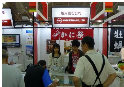
鳥取県企業は元気に拡販していた（㈱越河）