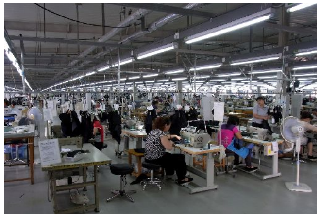
北京工場内の様子

当社はエフワンのスーツだけを縫製しているわけではないので（もちろんグッドヒルブランドやその他のOEMブランドについても数多く製造している）、日本国内のエフワンに限って言えば3万円以下の商品の生地は全て中国製で、それ以上のものは全て日本製或いは欧州製の生地となります。