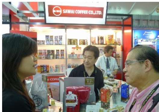
鳥取県企業は元気に拡販していた（㈱澤井珈琲）