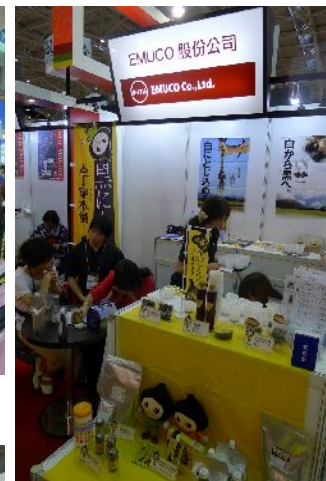
鳥取県企業は元気に 拡販していた （㈱エムコ）