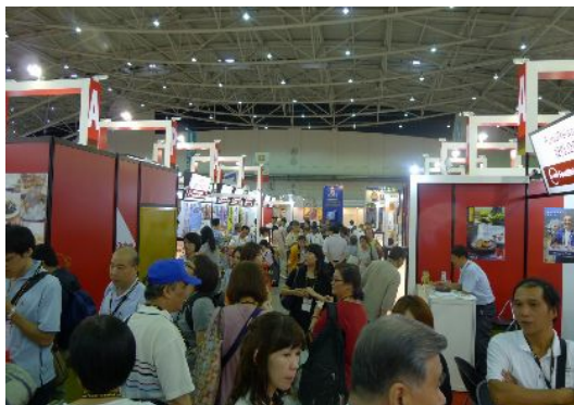
通路の様子。一見、混んでいるように見える。

「FOOD TAIPEI」が寂しく見える。美食もお金も、市場が大きいところに流れるという経済原則そのままの感じだ。しかし、台北も景気は悪くない。「人の行く裏に道あり花の山」。日本が一番の裏道だが、真っ暗闇を歩くと崖に落ちそう。夜明けの裏道、台湾の裏道を歩いてほしい。