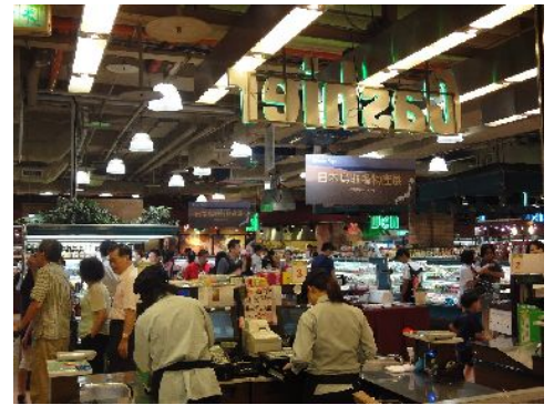
今年8月 微風広場(台北市)鳥取物産展の様子

そして一年で最大の贈答シーズンが中秋節。今年は、9月22日。基本的には月餅を送るが、月に見立てた柑橘類である文旦や、酒を贈りあい、中秋節当日には、市内各所の道路上で焼肉をする習慣があり、台北市内は、一面が焼肉の煙で充満する日となる。流通各社にとっては、贈答ターゲット日ごとに3ヶ月前から計画を立て売上増を競っている。