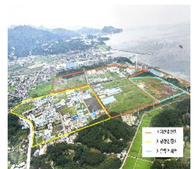
東海自由貿易地域

(財)鳥取県産業振興機構 海外支援グループ 担当：中江、早川 電話：0857-52-6703