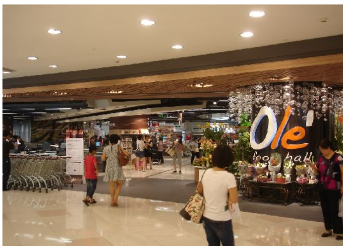
Ole' スーパー入り口の様子

住所： 上海市徐匯区虹橋路1号港匯広場地下一階 アクセス： 地下鉄1号線、9号線、11号線「徐家匯」駅 （1号線12番出口と港匯広場が連結）