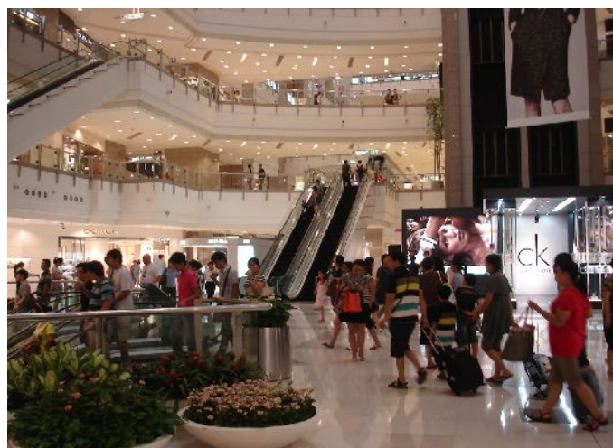
港匯広場一階の様子