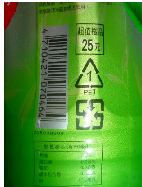
ボトルについている回収用環境マーク

最近TVCMでは「ビール緑茶」という飲料をばんばんと放送している。味を想像していただきたい。飲料選手権にコーヒー系が入っていないことは意外。またボトルには、日本と同様に回収用環境マークがつく。台湾に来て、いろいろと飲んでみませんか。