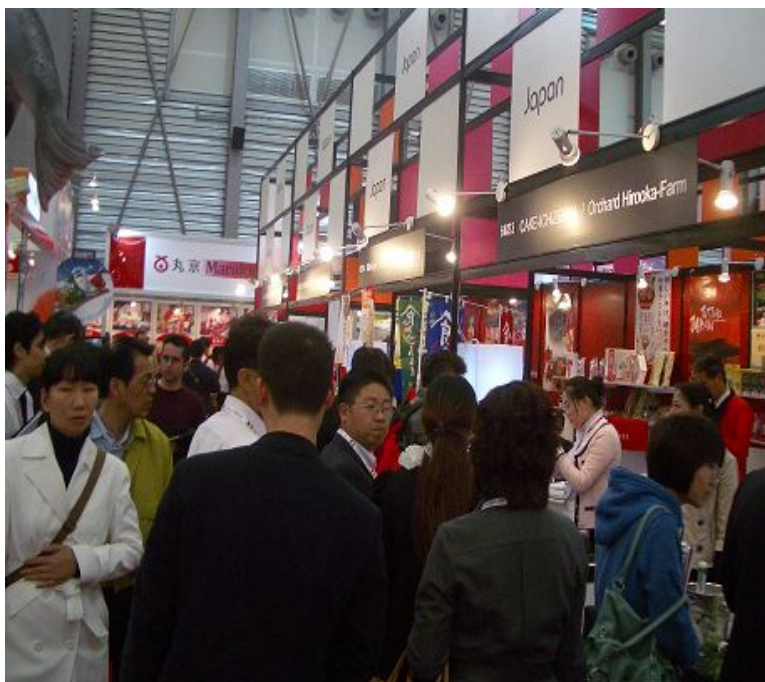
《日本パビリオンは連日多くの人で賑わった》