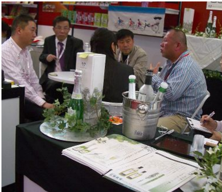
《来場したバイヤーと商談》