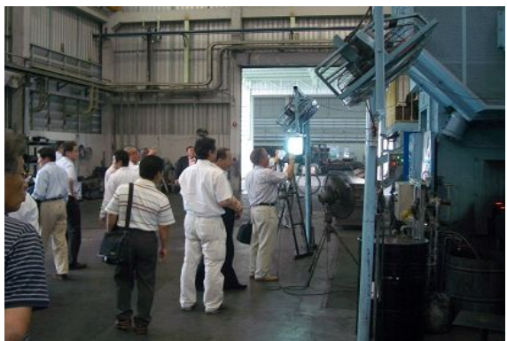
2/17 THAI GREEN FORGING 工場視察