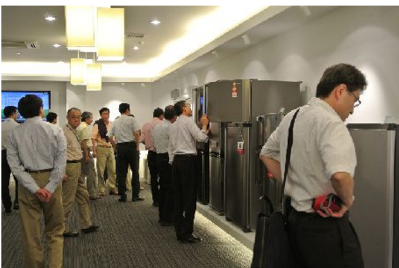
2/16 SHARP APPLIANCES 訪問