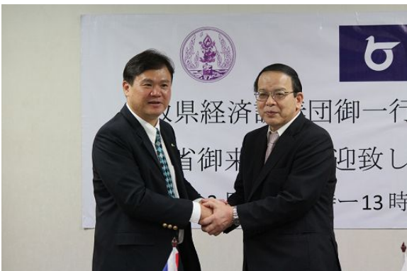
2/15 タイ工業省を表敬（左がナタボン副事務次官）