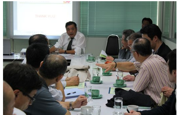
2/17 THAI SUMMIT MEIJI FORGING 訪問