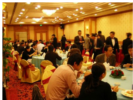
個別商談会・昼食会でパネラーが県産食材を試食