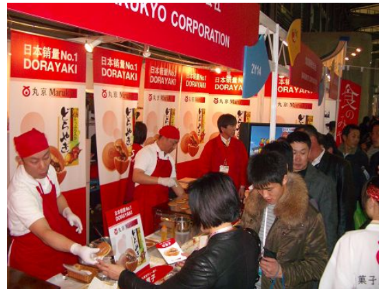
丸京製菓(株)ブースはどら焼きを実演し、行列が出来た