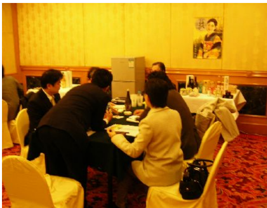
個別商談会の様子