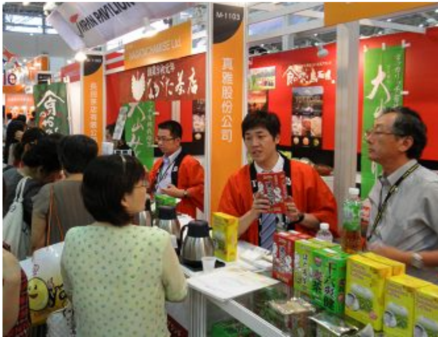
鳥取県出展ブースの様子（安心・安全な日本の食品は台湾で大人気）