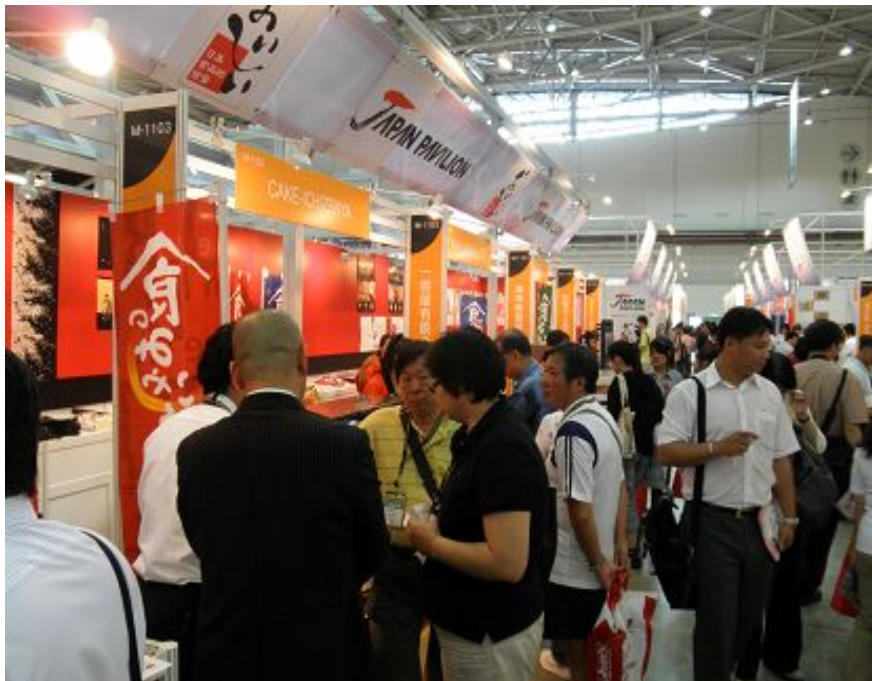
鳥取県出展ブースの様子（連日多くの来場者で賑わった）