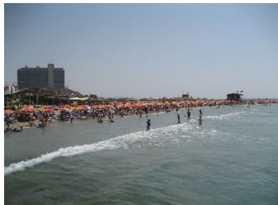
テルアビブの海岸では皆さん日光浴

ちなみに、外務省の渡航安全情報(2007年10月末現在)によると、エルサレム市やテルアビブ市は「十分注意してください」であり、これはタイ・バンコク市やインドネシア・ジャカルタ市と同じレベルですが、もちろん、当地に訪問される前には、最新の政治・治安動向等を確認するよう、お願いいたします。