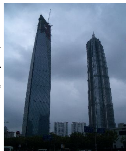
上海の高層ビルはとてつもなく高い

海外へチャレンジしたいが、どうしてもいかに分からない、という方は、一度とっとり貿易支援センターまでお問合せください。