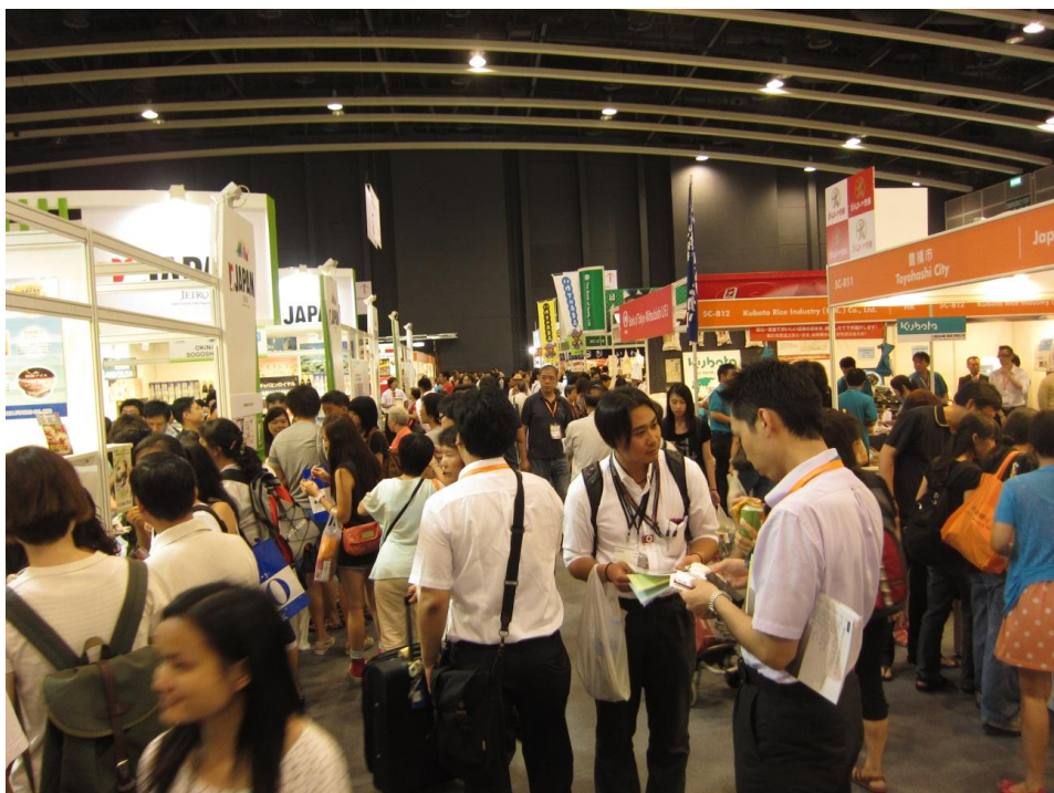
FOOD EXPO 会場内の様子