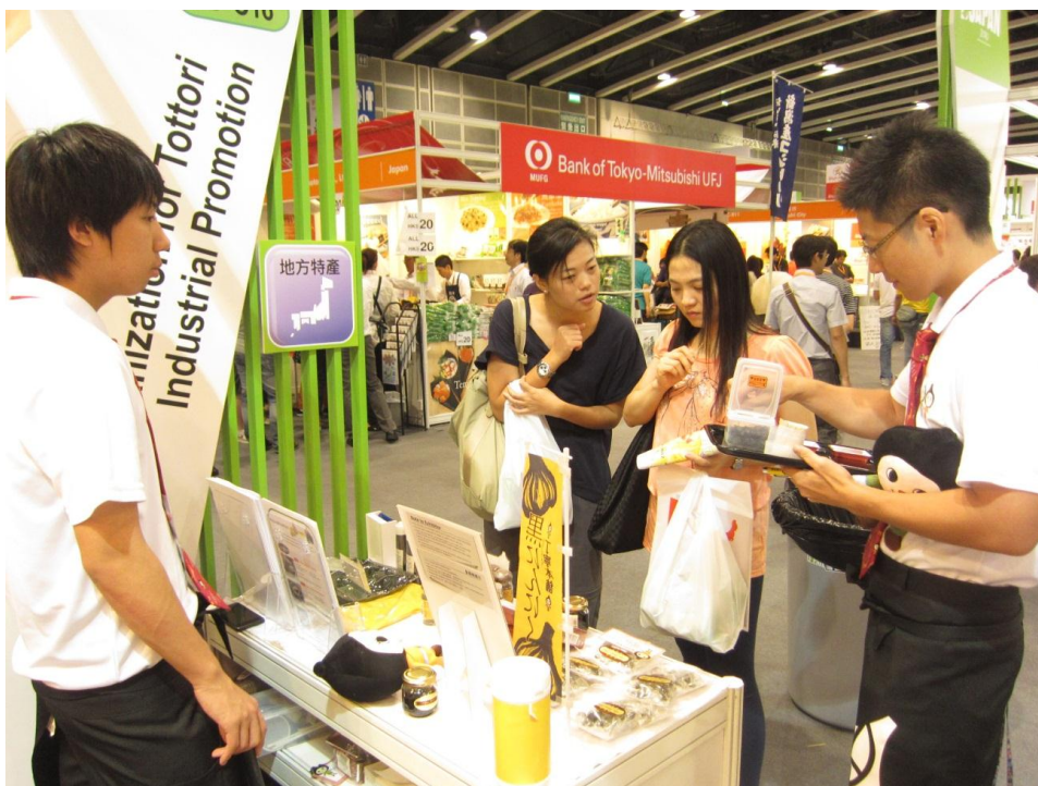
FOOD EXPO 出展の様子